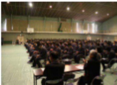
見事な発表に盛大な拍手