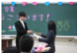
H校での担任から卒業証書授与