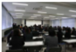
スライドで3年間を振り返って