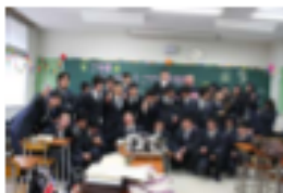
みんなで記念撮影