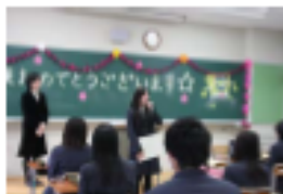
H校でみんなにメッセージ