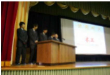
大勢の前で緊張の発表

二月四日(金)に、一年間の課題研究の成果を三年次機械科一、電気科二、普通科一の計五グループが計画、製作、反省・課題などをわかりやすく発表しました。